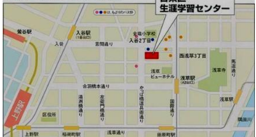
生涯学習センターまでの案内図

午前 8 時から午後 10 時まで 最初の 30 分 200 円、以降 15 分毎 100 円 午後 10 時～翌午前 8 時まで 60 分毎 100 円