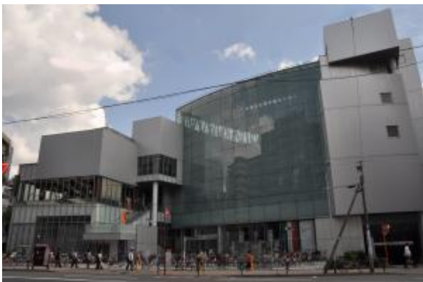
台東区生涯学習センター 外観